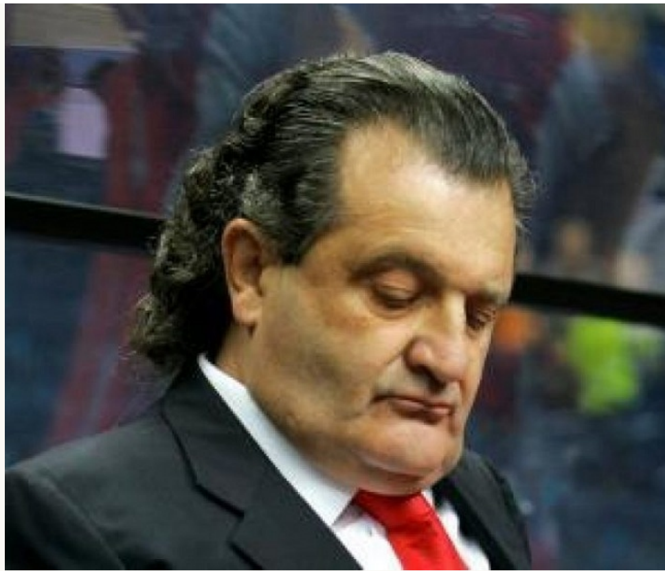
Семен Могилевич. Коллега Шабтая по опасному бизнесу. Февраль 2006 г. Могилевич (справа) и Кумарин на дне рождения Кума в Петербурге.