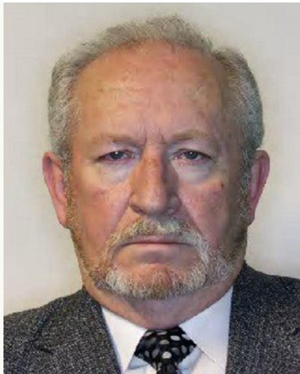
Андрей Нечаев, министр в правительстве Гайдара (1992-93), президент госпредприятия «Российская финансовая корпорация» (1993-2013 гг.).